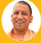
योगी आदित्यनाथ माननीय मुख्यमंत्री, उत्तर प्रदेश